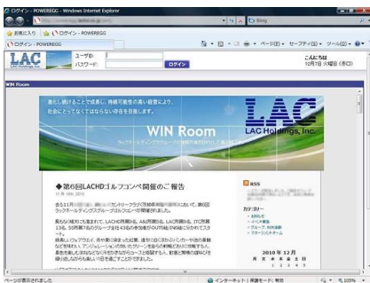
【ログイン画面 (Win Room)】

それに対し、ナビビューは仕事に関する公式ページですね。グループとはいえ以前は別々の場所で仕事していた所属会社の異なる社員たちが、いまは同じ場所で、同じようにログインし、同じ画面を見て、グループ全員が1つのサーバにアクセスして・・・、というのは何か壮観というか、ちょっと不思議な感じがします。しかし、確固とした情報共有基盤が稼働している実感がありますね」